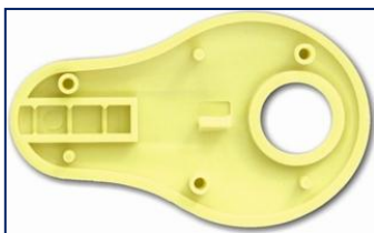
Vnitřek pouzdra bez aktivního čipu