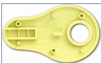
Vnútrajšok púzdra bez aktívneho čipu