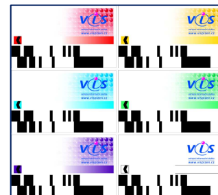
Barevné varianty karet

Část zadní strany karty slouží jako tzv. rezervovaná plocha. Tuto plochu mohou využívat jídelny, které mají zájem o vlastní vzhled karty, nebo které v rámci své doplňkové činnosti nabízejí plochu jako reklamní prostor jiným subjektům. V případě nezájmu ze strany provozovatele stravovacích služeb je tento prostor nabídnut třetím stranám.