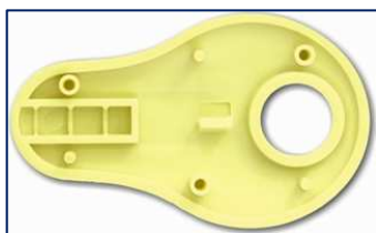
Vnitřek pouzdra bez aktivního čipu